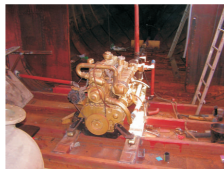
De nieuwe dieselmotor DAF 575