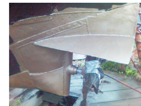
De nieuwe schroef is nog ingepakt met plastic tegen de verfspetters