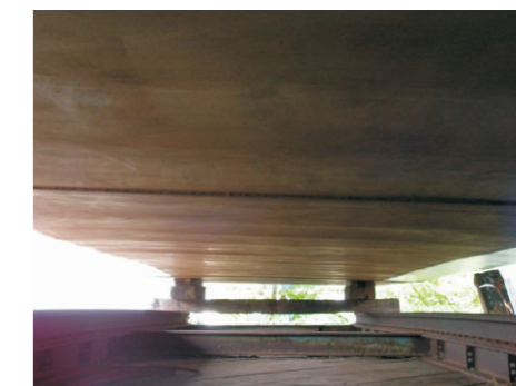
Het vlak is klaar en geveerd