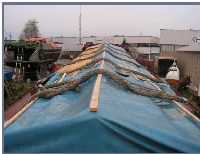
Dirk met provisorische ruimaftichting

We hebben nog geen bericht van de Museumhaven Gouda ontvangen, maar we hebben goede hoop op een positieve beslissing.