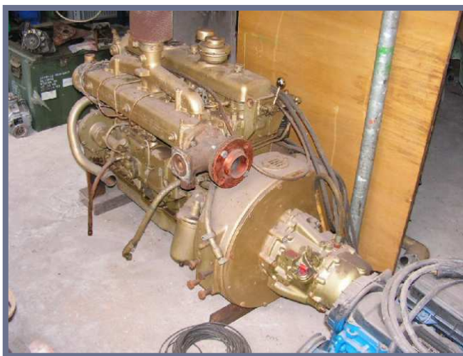
De motor die nu in Dirk geplaatst wordt.

Dirk was de ruimte in het achterschip, het paviljoen, de leefruimte van de schipper. Wij willen deze leefruimte weer precies zo intimmeren. Om deze reden komt de motor bij Dirk in het laadruim te staan. De schroefas komt in een buis, zo laag mogelijk over het vlak te lopen. We hebben gekozen voor een onderhoudsvrije, roestvrijstalen schroefas.