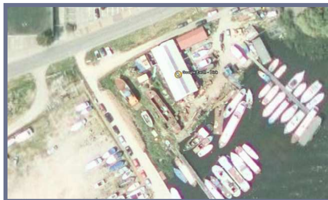
Dirk, gezien vanuit de ruimte